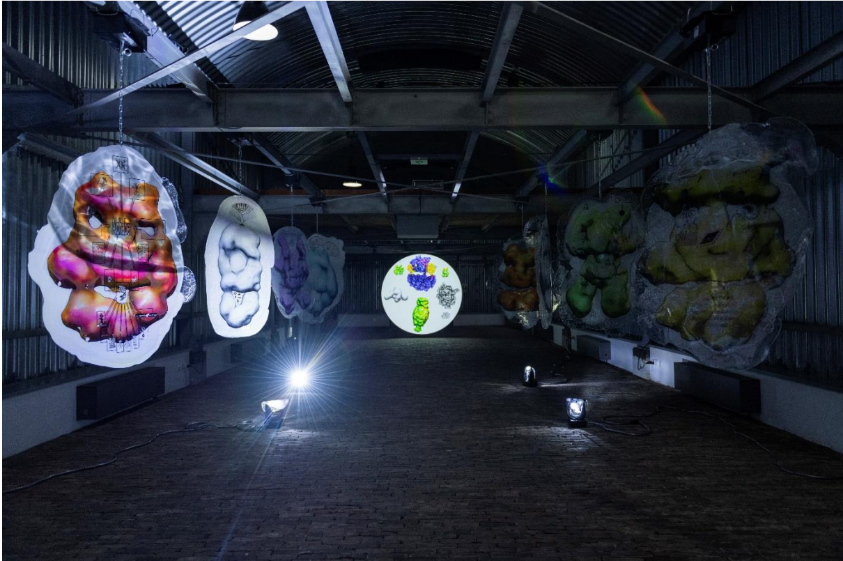
Katja Novitskova, Microbial Oasis , tentoonstellingsbeeld Kunstfort bij Vijfhuizen, 2021.