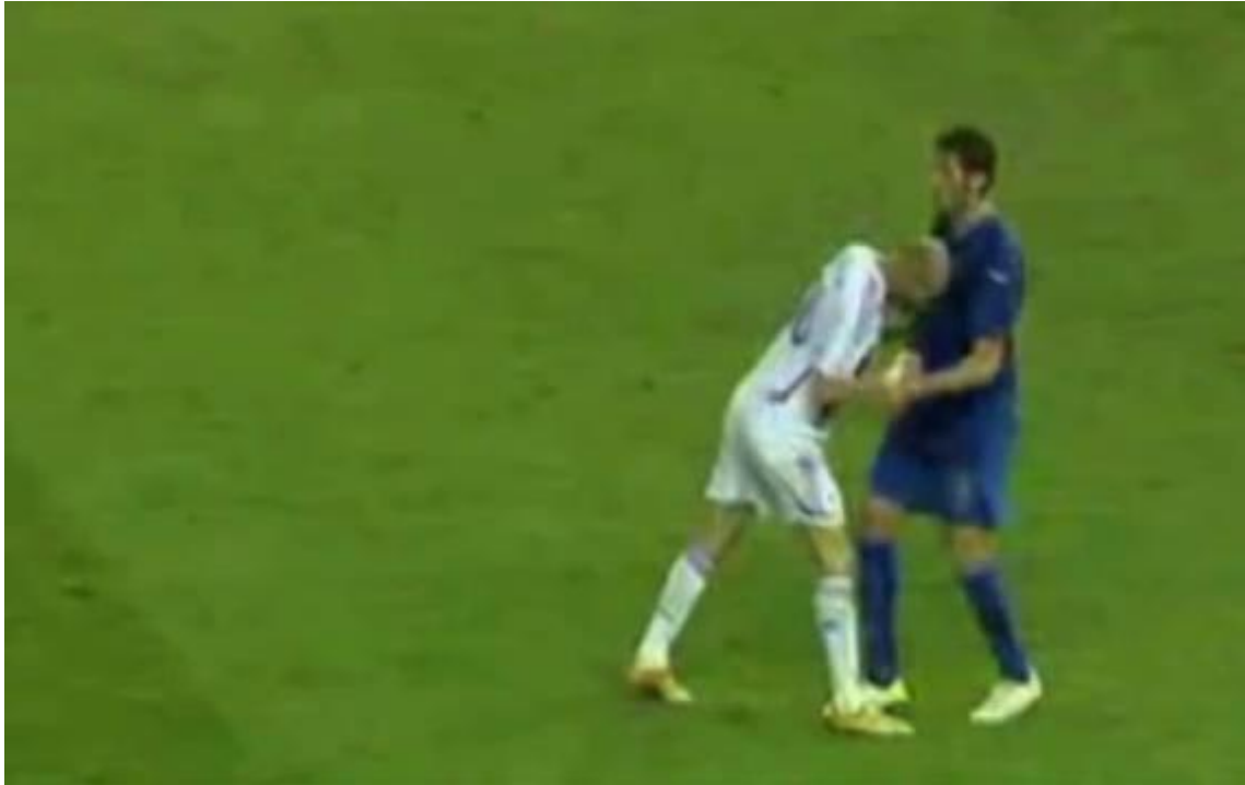
Claudia Rankine & John Lucas, Situation 1: October 10, 2006 / World Cup.