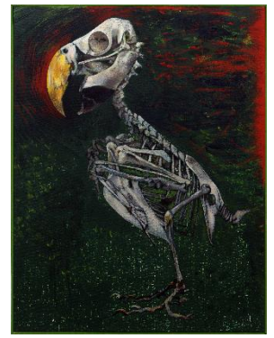
Ara, 1990

Het Kunstfort opent 2017 met schilderijtentoonstelling van Erik Andriesse en site-specific installatie van Tamar Harpaz